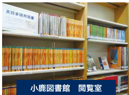
小鹿図書館 閲覧室