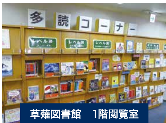
草薙図書館 1階閲覧室